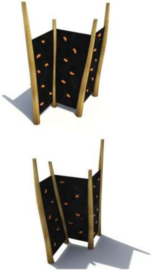
Vizualizace mají informativní charakter.